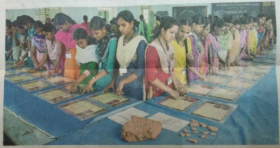
உ டுமலை ஜி.வி.ஜி. விசாலாட்சி மகளிர் கல்லூரியில் நடந்த, நாணய கண்காட்சியை பார்வையிடும் மாணவியர்.

இரண்டு நாட்கள், கண் காட்சி, கல்லுாரி அரங்கில் நடந்தது. பல்லடத்தைச் சேர்ந்த தமிழர் பண்பாட்டு SUULL ON.